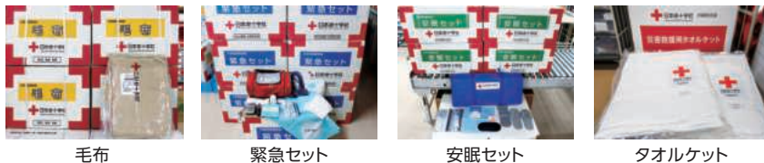
毛布 緊急セット 安眠セット タオルケット

個人の住宅やマンションが火災や水害等に遭われた際、毛布や緊急セットなどを配付しました。また、不幸にもお亡くなりになられた場合には、ご遺族に災害見舞金を交付しました。